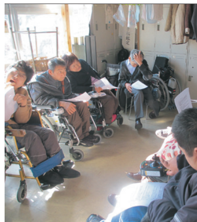
当日の講座の様子